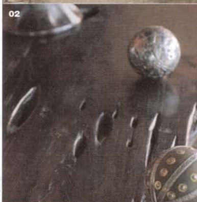
02 Erosion Wood. Jahrzehnte in Reisfeldern gelegenes Holz nimmt weiche, organische Formen an. Hier als Tischplatte verarbeitet